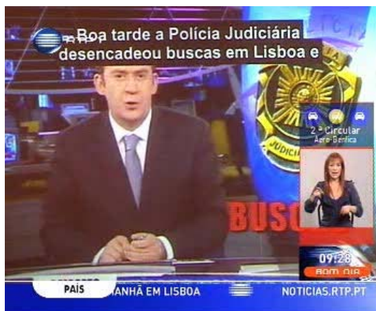
Figura 3 – Legendagem em teletexto automática e interpretação em língua gestual do programa da RTP1 “Telejornal” 1

A interpretação dos conteúdos televisivos em língua gestual tem especial interesse para os telespectadores com deficiências auditivas. O modelo seguido em Portugal baseia-se na introdução de uma pequena área no canto inferior direito do ecrã de televisão, onde um intérprete efectua a tradução do que é dito no programa televisivo (Figura 3).