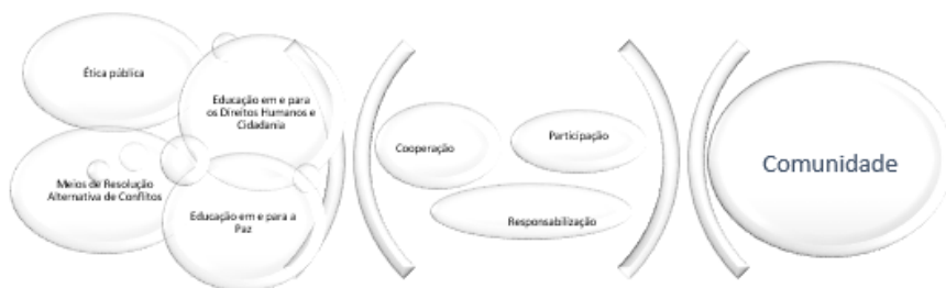
Figura 1: Projetos de empreendedorismo humano-social: como?

Mas, o que deve entender-se por ética pública? Peces-Barba distingue a dicotomia entre ética pública – ética privada nos seguintes termos: